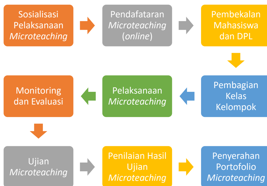
Gambar 3.1. Tahapan Pelaksanaan Microteaching

Alur pelaksanaan Microteaching di STKIP PGRI Sumenep terdiri dari sosialisai program Microteaching , pendaftaran, pembekalan, pelaksanaan, monitoring dan evaluasi, ujian microteaching , pelaporan, dan pemerolehan nilai. Adapun alur pelaksanaan Microteaching sesuai gambar berikut: